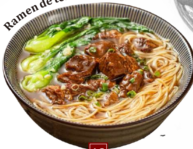
Ramen de ternera 9.50€