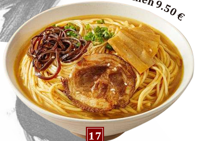
Char siu ramen 9.50 €